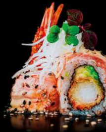
SALMON & FIRE ebi fry | flam. lachs | avocado spezielsauce | sesam bd 8 stk.