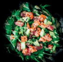
SASHIMI SALAT lachs | tuna | avocado gemischter salat | sesam dressing d