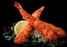
EBI FRY frittierte garnelen mit japanischer panko | spicy-mayo afk 3 stk.