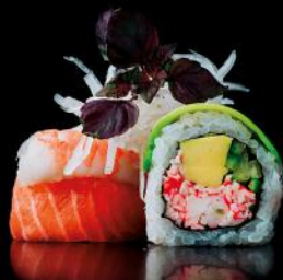
8 Treasure kani | avocado | lachs | tuna | ebi | hamachi spicy-mayo | unagi sauce bd | 8 stk.