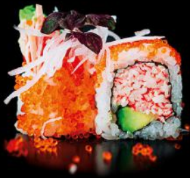
CALIFORNIA surimi | avocado | 8 stk. d