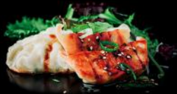
GYOZA lauchzwiebeln | teriyaki sauce sesam | 5 stk. 4afk