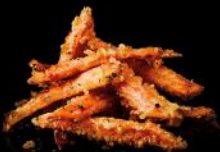
SÜBKARTOFFEL TEMPURA mit trüffel-mayo a