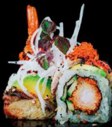
BLACK DRAGON ebi fry | gurke | unagi avocado | masago | unagi sauce bd 8 stk.