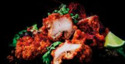
TORI KARAAGE knuspriges hühnchen spicy-mayo 4ac