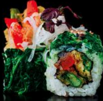
PICCOLO tempura gemüse | spinat | miso sauce | sesam 4stk 8 stk.