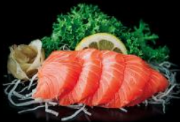
LACHS 5 STK 14,50