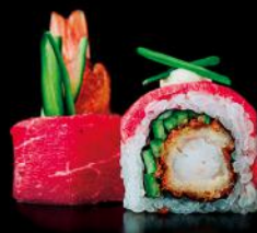
SURF & TURF ebi fry | rindercarpaccio | avocado | trüffel-mayo bd 8 stk.