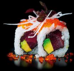
BOSTON tuna | avocado | 8 stk. d