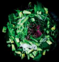
PONZU WAKAME Algensalat | Avocado | Gurke Sesam