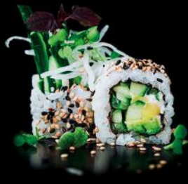
VEGGIE CREAM avocado | gurke | 8 stk. d