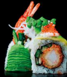
GREEN DRAGON ebi fry | gurke | avocado | tobiko spicy-mayo bd 8 stk.