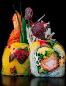
SAMBA ebi fry | schnittlauch | avocado | gurke cream | mango bd 8 stk.