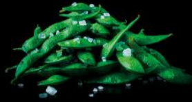
EDAMAME mit Trüffel sojabohnen | frischer rettich fleur de sel fk