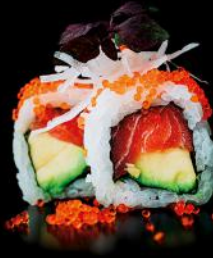
ALASKA lachs | avocado | 8 stk. d