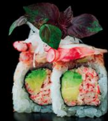
UMAMI kani | gurke | avocado | octopus | spicy-mayo | spicy tuna bd 8 stk.