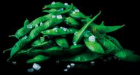
EDAMAME sojabohnen | frischer rettich fleur de sel fk