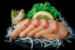
HAMACHI 5 STK 15,90