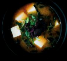
MISO SUPPE tofu | lauchzwiebeln | seetang 4f