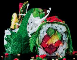
FANCY SHISO ROLL shiso blatt | tempura spargel | rote beete | avocado | sesam sauce