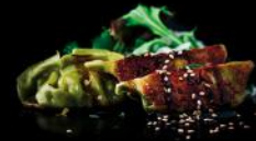
VEG. GYOZA 4afk lauchzwiebeln | teriyaki sauce | sesam | 5 stk. 4afk