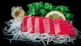
THUNFISCH 5 STK 15,50