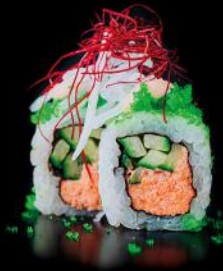
SPICY SALMON gekochter Lachs | gurke | 8 stk. d